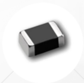
VS系列叠层片式压敏电阻器