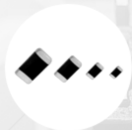
HYNS系列片式NTC热敏电阻