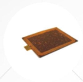
近场通讯天线模组